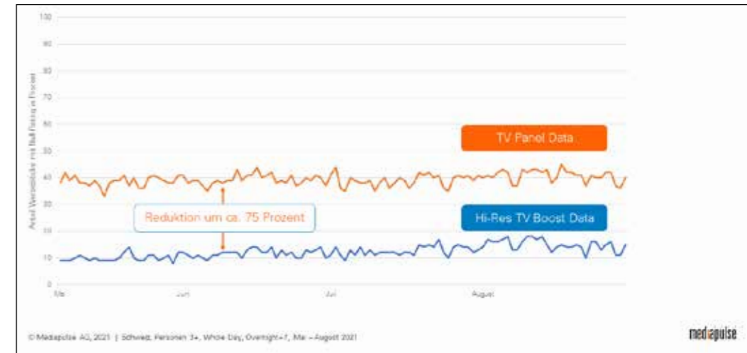
Vorteile durch Hybridisierung: Reduktion der Nullerratings.

Von der Hybridisierung der TV-Messung profitieren alle Marktteilnehmenden. Der Werbemarkt in Form einer klaren Verbesserung für TV-Werbekampagnen: Mit der hybriden Messung erhalten drei von vier Werbeblöcke, die mit der heutigen Messung noch null ausweisen, einen genauen Messwert. Das ergibt sowohl für die Planung als auch für die Erfolgskontrolle von ausgestrahlten TV-Werbekampagnen wesentliche Vorteile.